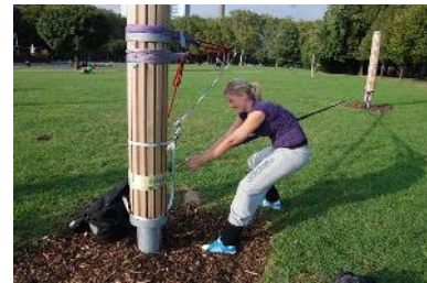
Slacklines