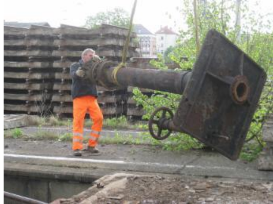
Lok-Betankungsanlage, Teil des demontierten Standfusses