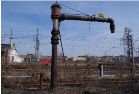
Lok-Betankungsanlage am bisherigen Standort

Heute wurde eine Lok-Betankungsanlage gesichert, die auf dem Bürgerbahnhof künftig als Sommerdusche dienen soll. Wo genau das gut 2 Tonnen schwere Element aufgestellt wird, müssen die IBBPlerInnen noch entscheiden, aber es zeichnet sich eine Mehrheit für eine Aufstellung im Gelände von Bauspielplatz und Pfadfindern ab.